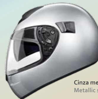
Cinza metalizado Metallic silver