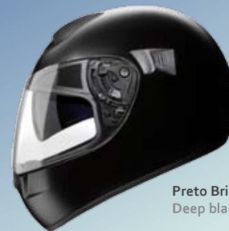
Preto Brilhante Deep black