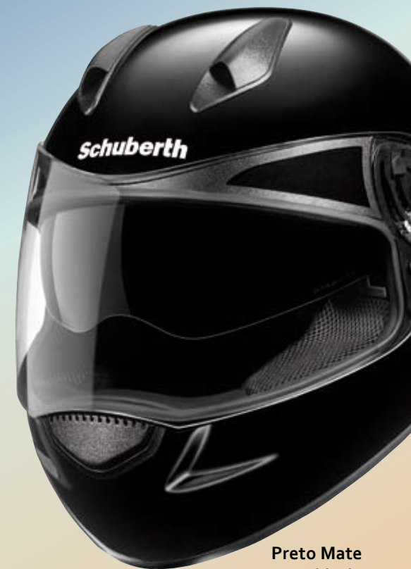
Preto Mate Matt black

Verifique em www.schuberth.com o leque actual de cores e decorações. Check out www.schuberth.com to see the current range of styles and colours.